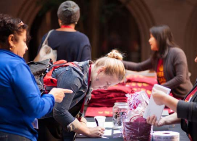
ՈՎՔԵՐ ԵՆ ԽՆԱՄՈՂՆԵՐԸ